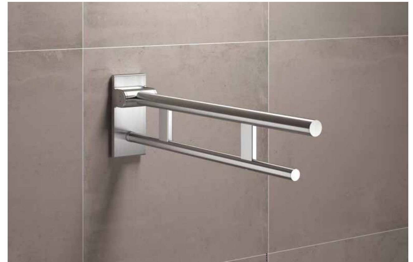
Abb.: CaraComfort Stützklappgriff CARCPSTG70