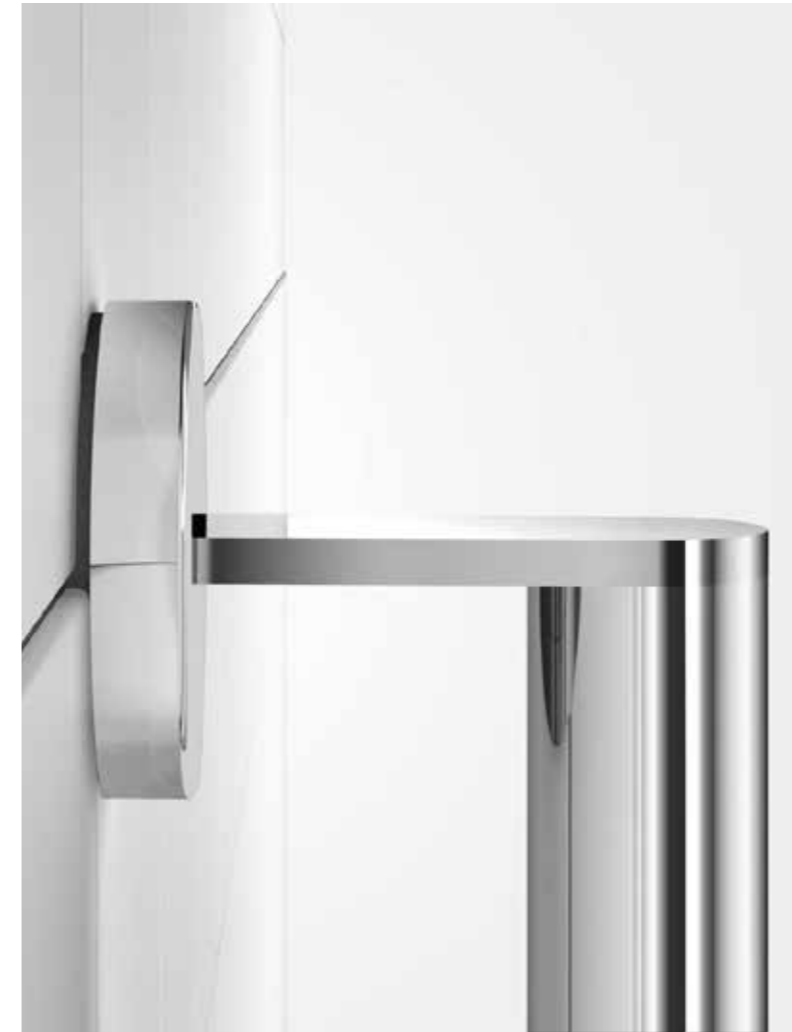
Abb.: CaraComfort Wandrose

Bodengleiche Duschen sind Standard im barrierefreien Bad. Der Grund ist die elegante Anmutung und die leichte Begehbarkeit für jeden Nutzenden. Sie ist barrierefrei und ermöglicht mit der richtigen Grundfläche auch RollstuhlfahrerInnen das Eigenständige Duschen. Allerdings macht nicht nur die Ebenerdigkeit die Dusche zu einer barrierefreien Dusche. Duschsitze, Haltegriffe und viele weitere Produkte tragen maßgeblich dazu bei, eine Barrierefreiheit in der Dusche zu schaffen.