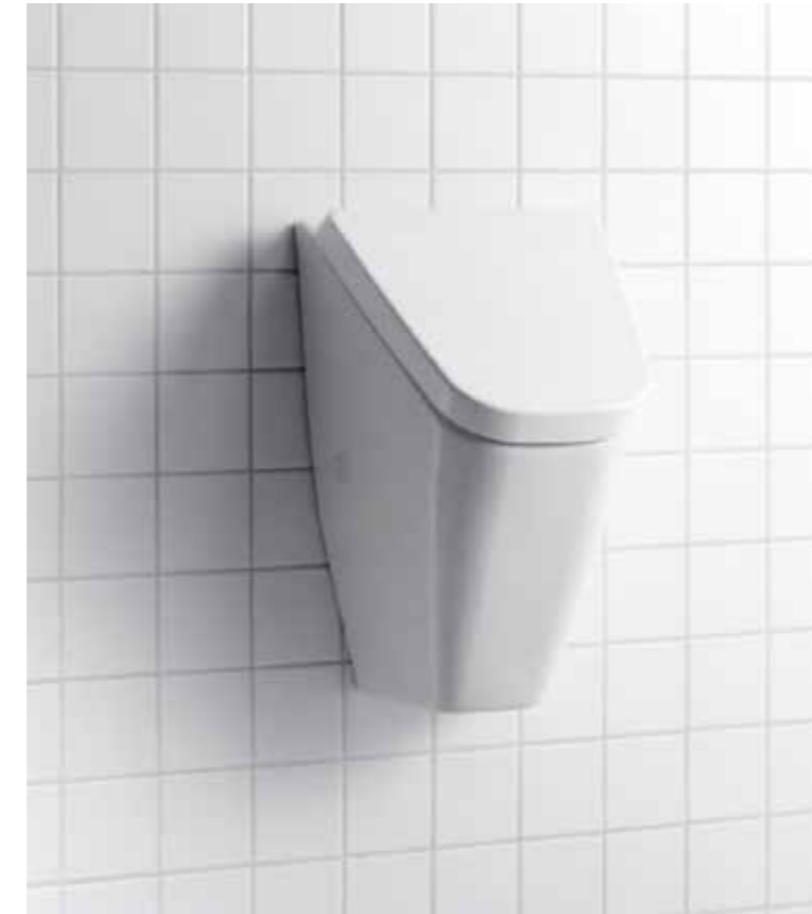
Abb.: Urinal CaraComfort CARU