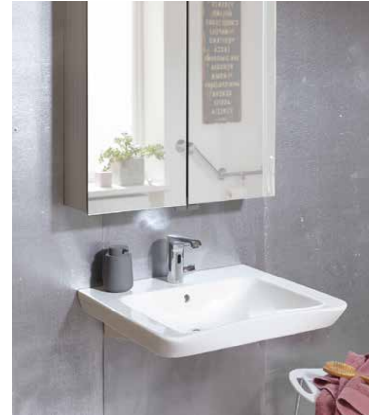
Abb.: CaraComfort Waschtischarmatur CARCPE120