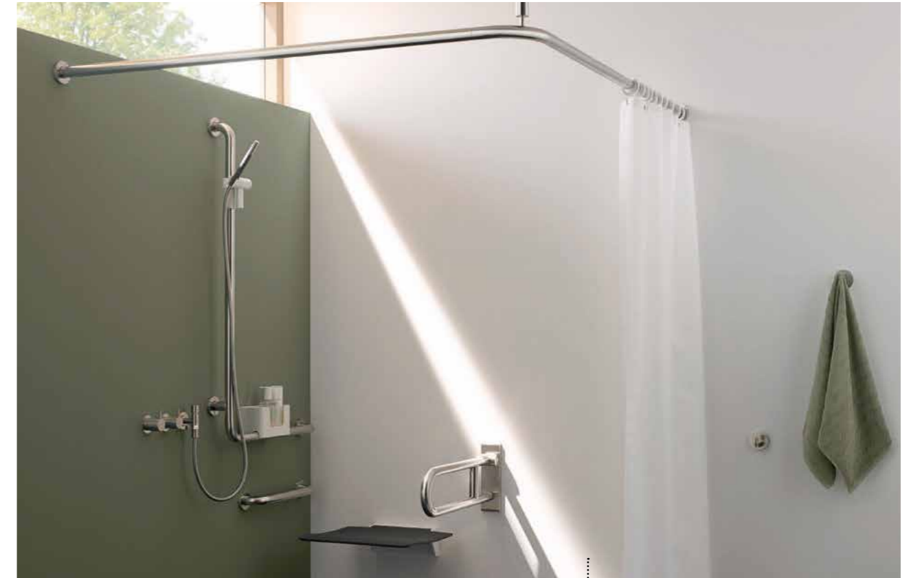
Abb.: CaraComfort Winkelgriff mit Brausehalter weiß CARCPWG12560RWE