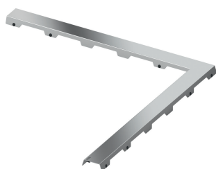
Design "steel II"