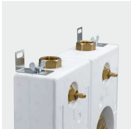
Befestigungsdarstellung inkl. Montagewinkel