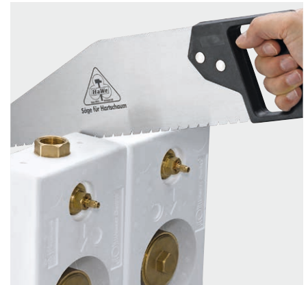
Trennung des Montageblocks (zum Singleblock) mit handelsüblicher Säge