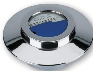
UP-Kompaktzähler für modulares Funkssystem (ECO)